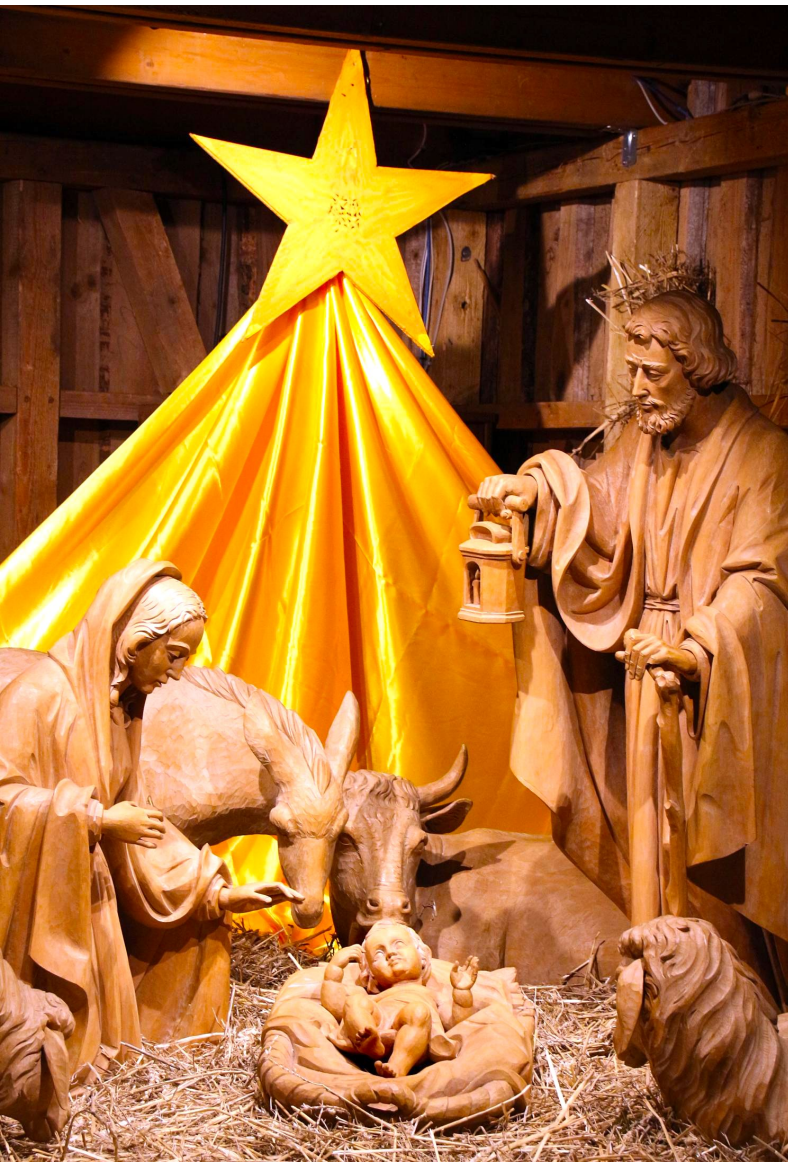
Weihnachtskrippe auf dem Erfurter Domplatz