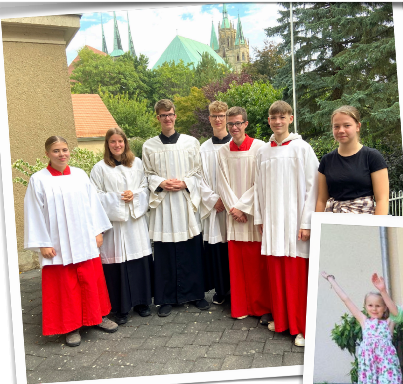
Bild unten: Kinder besuchen die Kinderkirche (Kiki) und haben einen Blumenteppich gelegt.

Bild Mitte: Bei der Bistums- wallfahrt in Erfurt sind unsere älteren Messdiener dabei.