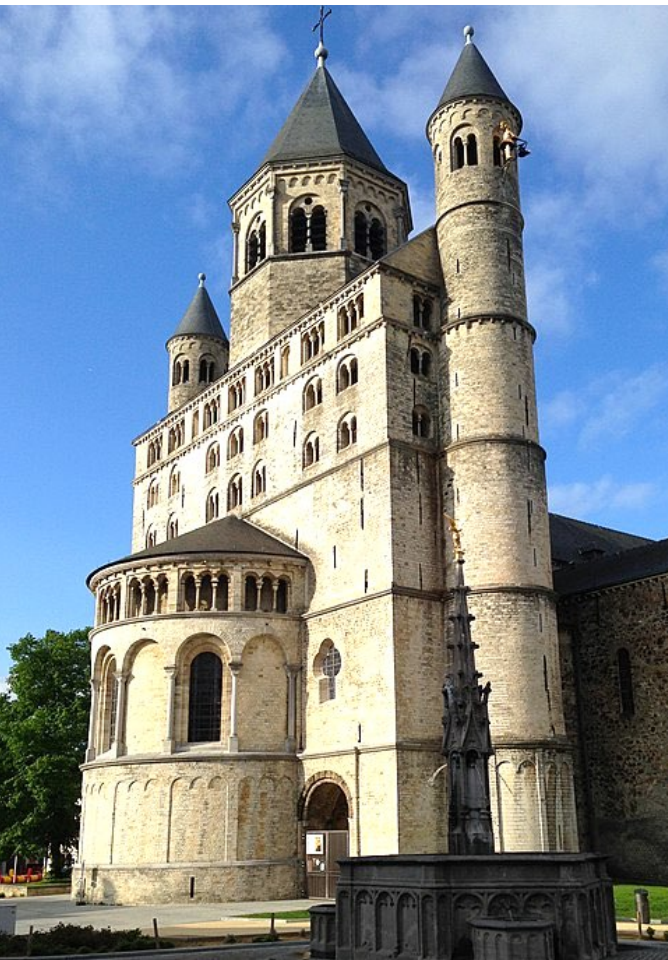
Foto: Stiftskirche in Nivelles