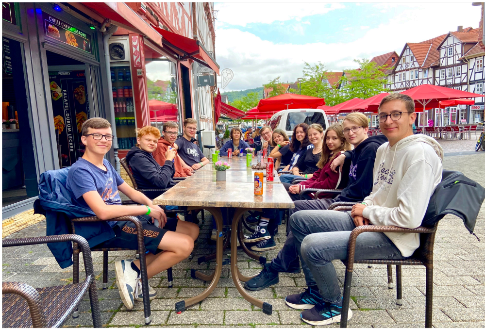
Bild oben: Einige Jugendliche der Pfarrei zelten am Werratalsee und stärken sich in Eschwege.

Bild Mitte: Bei der Bistums- wallfahrt in Erfurt sind unsere älteren Messdiener dabei.